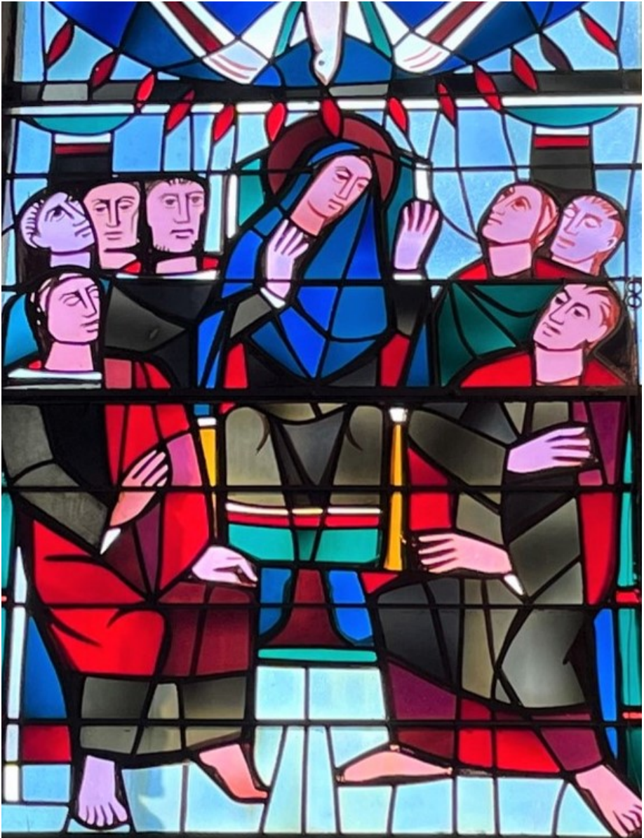
Pfingstszene aus der Pfarrkirche St. Nikolaus in Greimerath